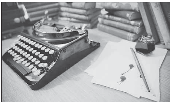
Основният инструментариум на самиздата

В самиздата следователно започват да се появяват не само копия на нецензурирани и съответно непубликувани произведения, но и стихотворения, които се преписват или препечатват от книги, някога издадени, но станали, по думите на Кублановски, „библиографска рядкост“.