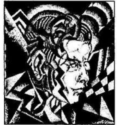
Николай Дюлгеров Портрет, 1924