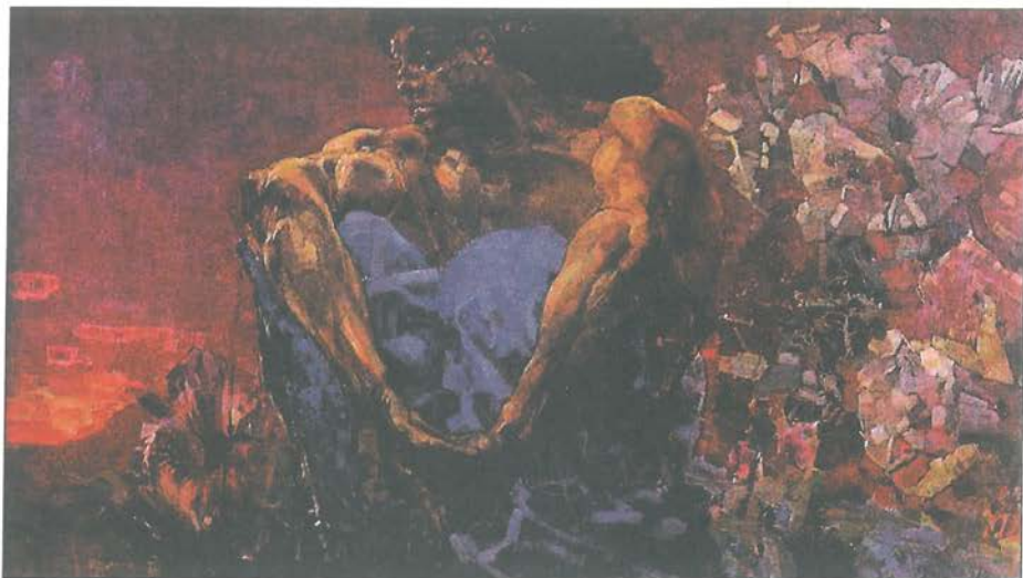
М. А. Врубел, Седящият демон , 1890