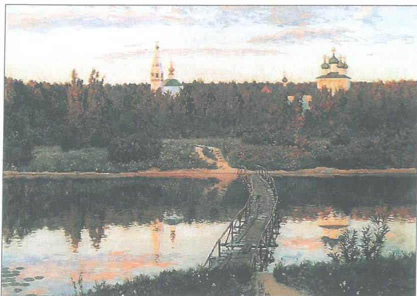
И. И. Левитан, Тиха обител , 1898