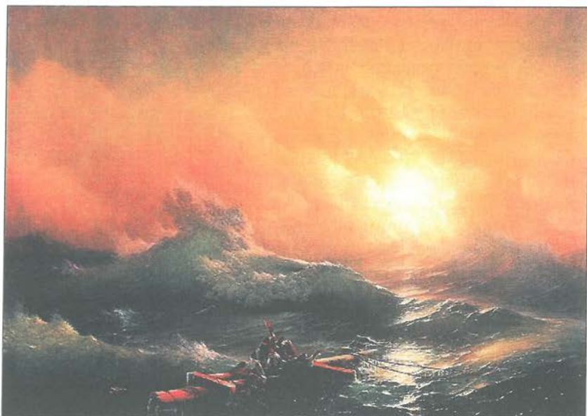
И. К. Айвазовски, Деветият вал , 1850