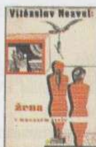
В. Незвал, Жена в множествено число , 1936