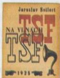
Ярослав Сайферт, На вълните на TSF , 1925