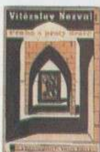
В. Незвал, Прага с дъждовни пръсти , 1936