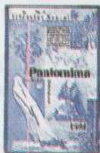
Витезслав Незвал, Пантомима , 1924