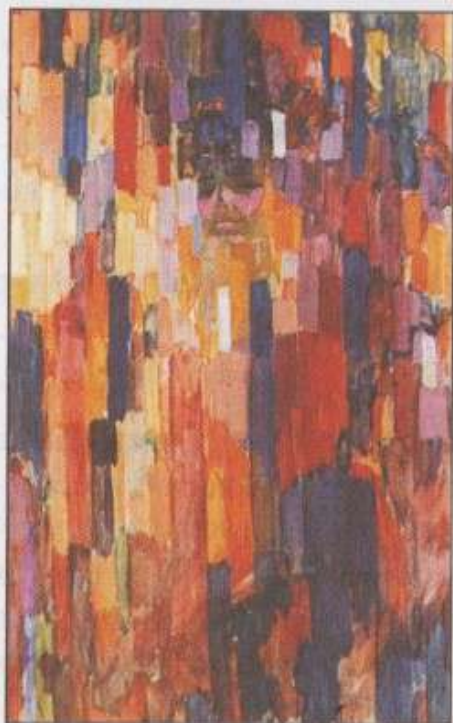
Франтишек Купка, Госпожа Купка сред вертикали , 1910-11