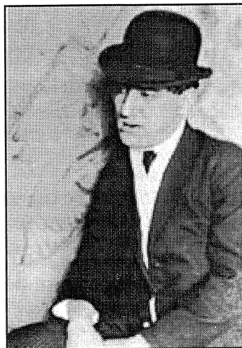
Снимка: Ман Рей

Срещу името на Паскин години наред е звучала нелепата присъда – родоотстъпник, враг... Въпреки че е напуснал страната едва седемгодишен и че е странствал из Германия, Франция, САЩ, Латинска Америка, той