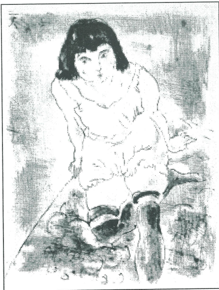
Жул Паскин, Събуждане , 1924