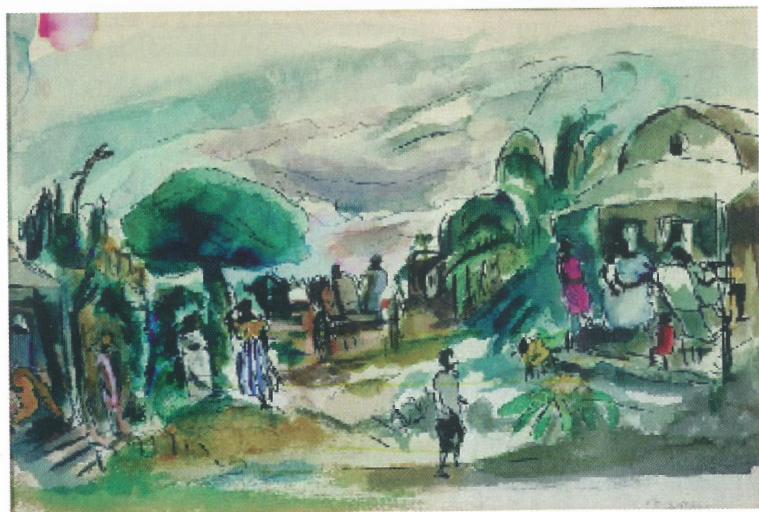
Жул Паскин, Кубинска сцена , 1917