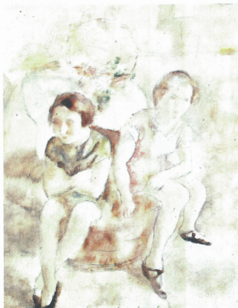
Жул Паскин, Две момичета